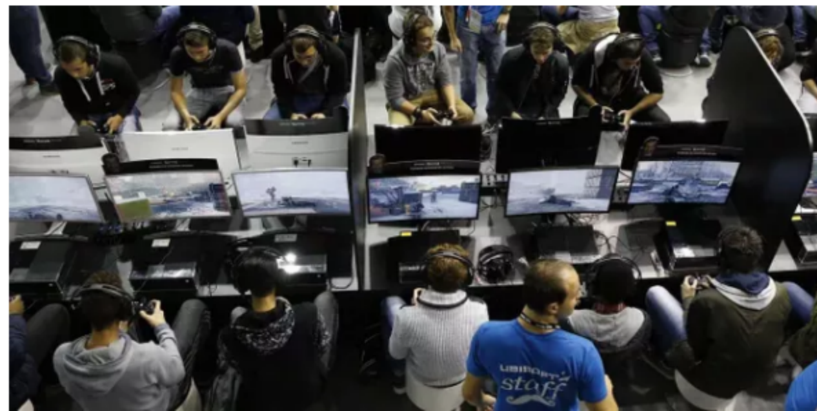
La Paris Games Week ouvre ses portes jeudi à Paris.